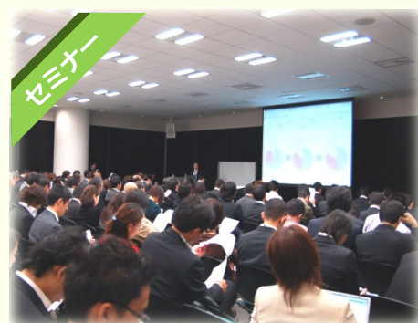
回答はボタンひとつで自動集計